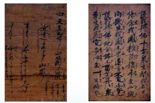
皇太子聖徳奉讃断简 (親鸞聖人御真筆) <一宮市・蓮開寺蔵> 四十八願文拔書断简 (親鸞聖人御真筆) <犬山市・立圓寺蔵>

—その信仰のすがた— 尾張浄土真宗の歴史的な姿を、70点に及ぶ法宝物史料から、ひもときます。貴重な親鸞聖人の御真筆なども出陳します。